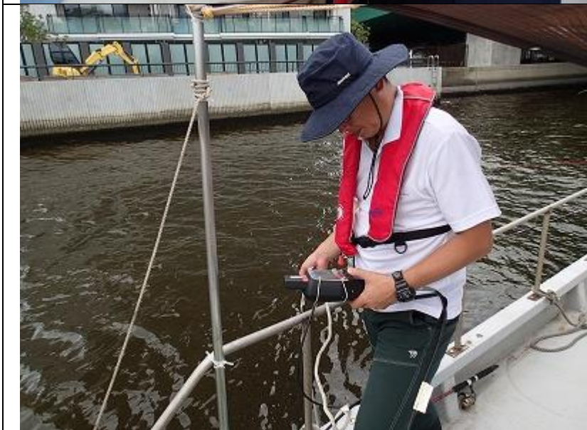
8 月期 海域環境調査 水温・塩分・DO の測定