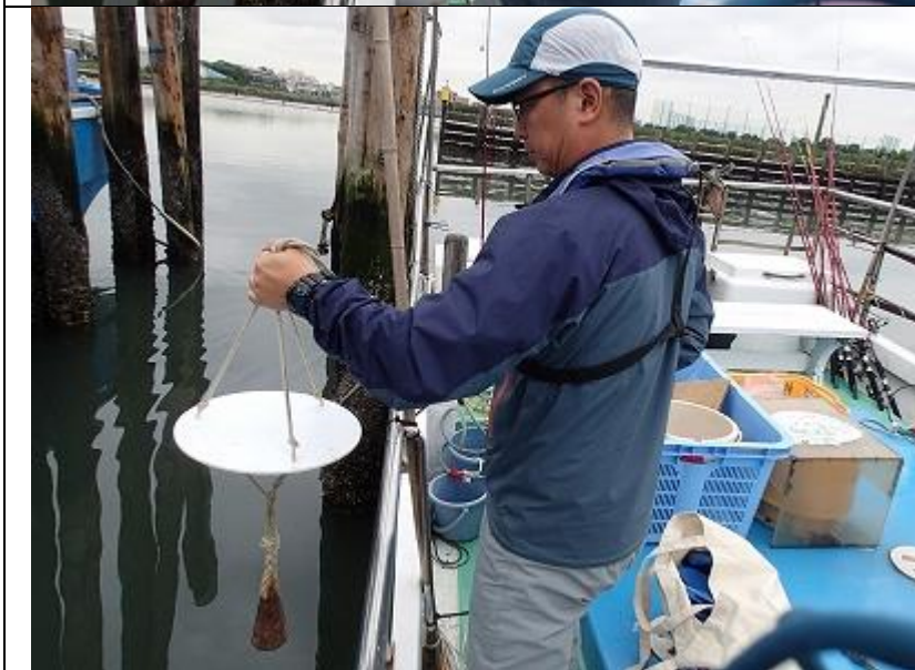
9月期 海域環境調査 透明度の測定