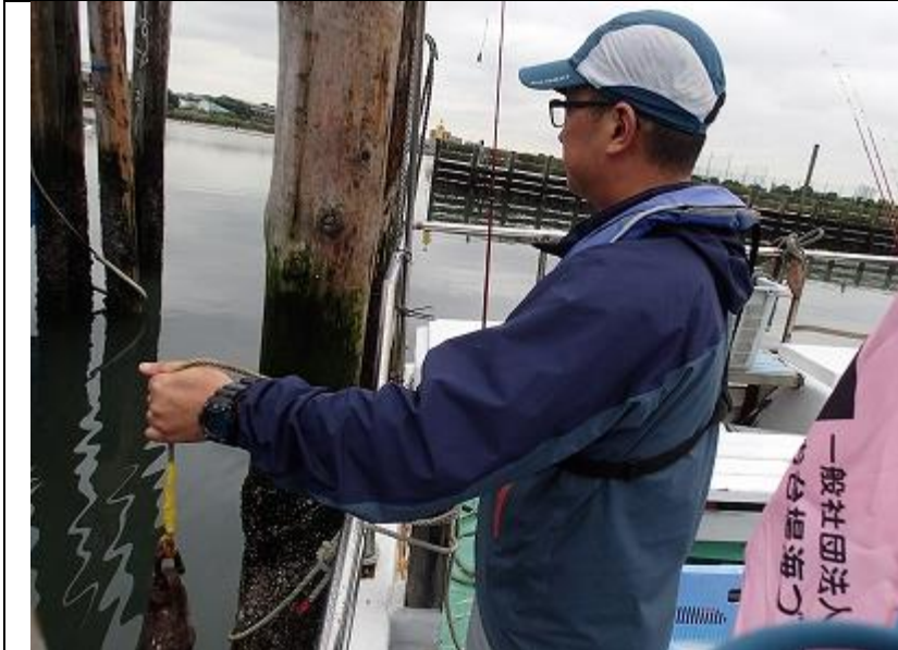
9月期 海域環境調査 水深の測定