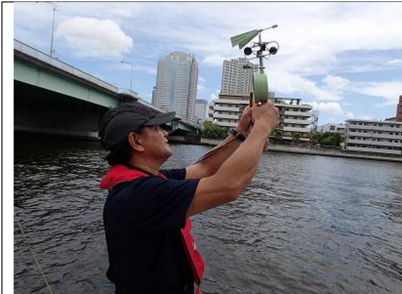
8 月期 海域環境調査 風向・風速の測定