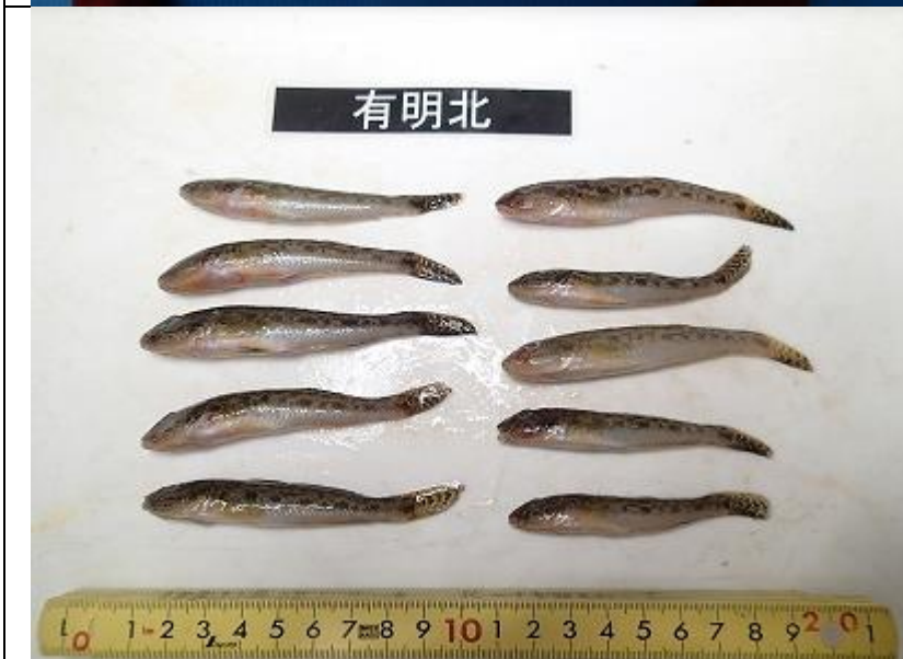
9月期 釣り調査 有明北その1 持帰り計測サンプル (全長・体長・湿重量測定)