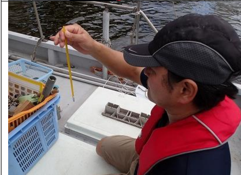
8 月期 海域環境調査 気温の測定