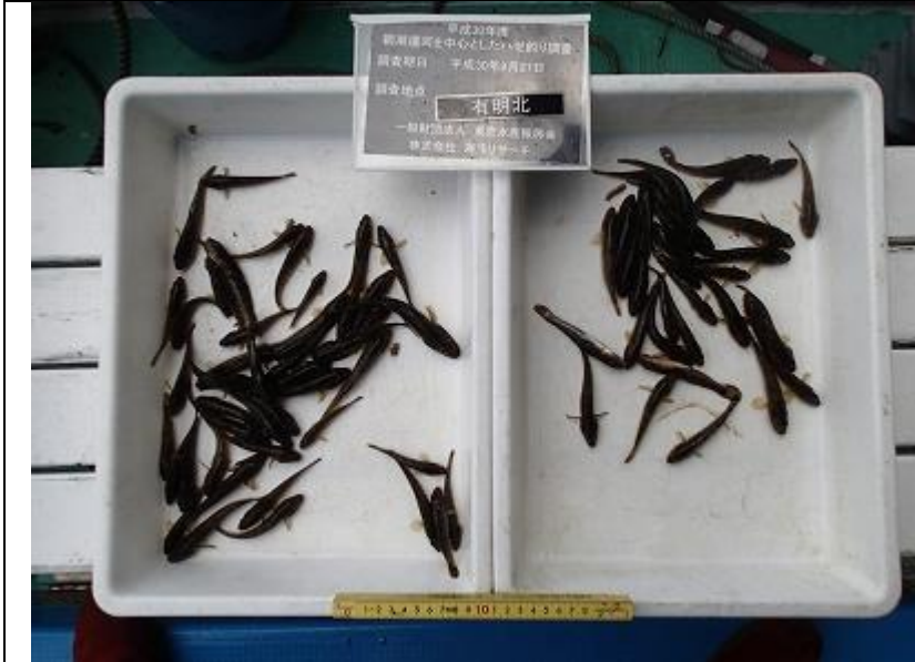
9月期 釣り調査 有明北 全サンプル (全長測定)