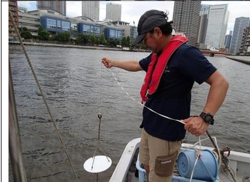
8月期 海域環境調査 透明度の測定