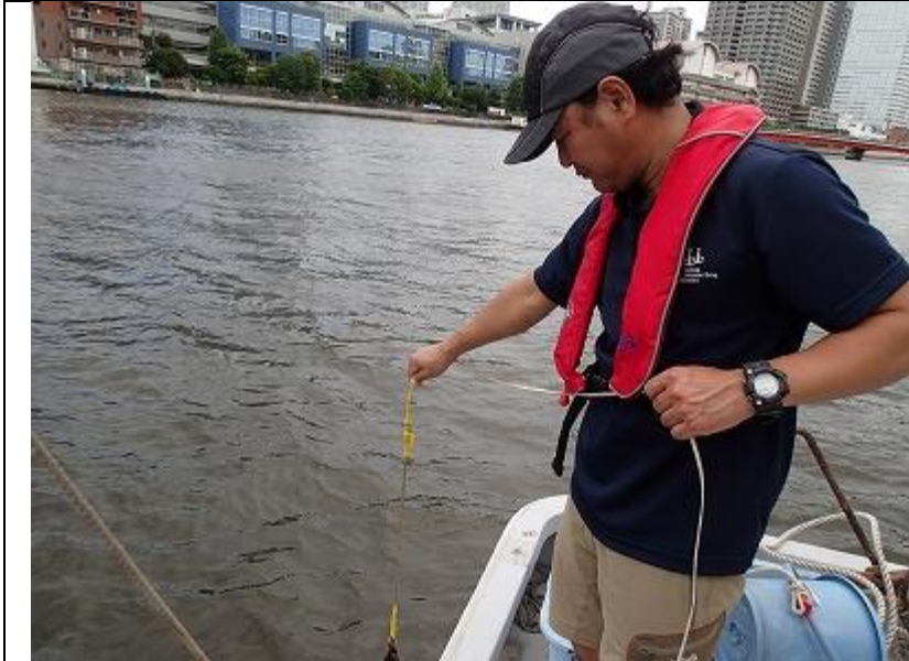
8月期 海域環境調査 水深の測定