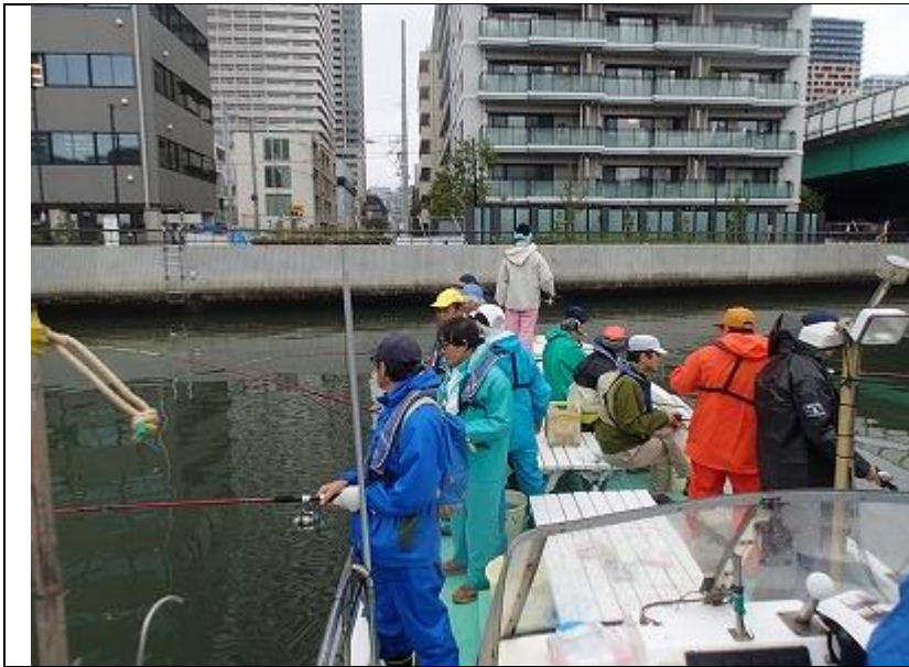
9月期 釣り調査 釣り調査風景