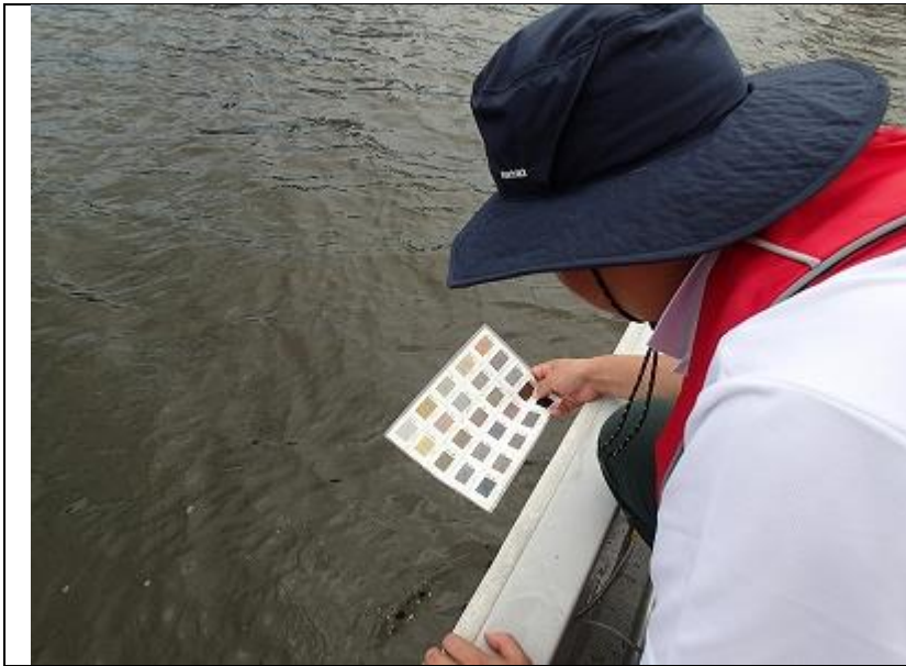
8月期 海域環境調査 水色の観測