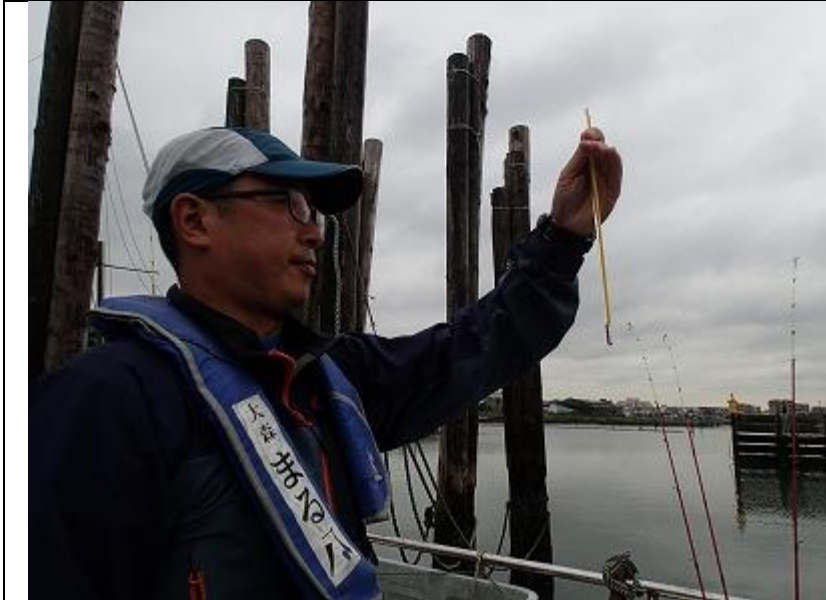
9月期 海域環境調査 気温の測定