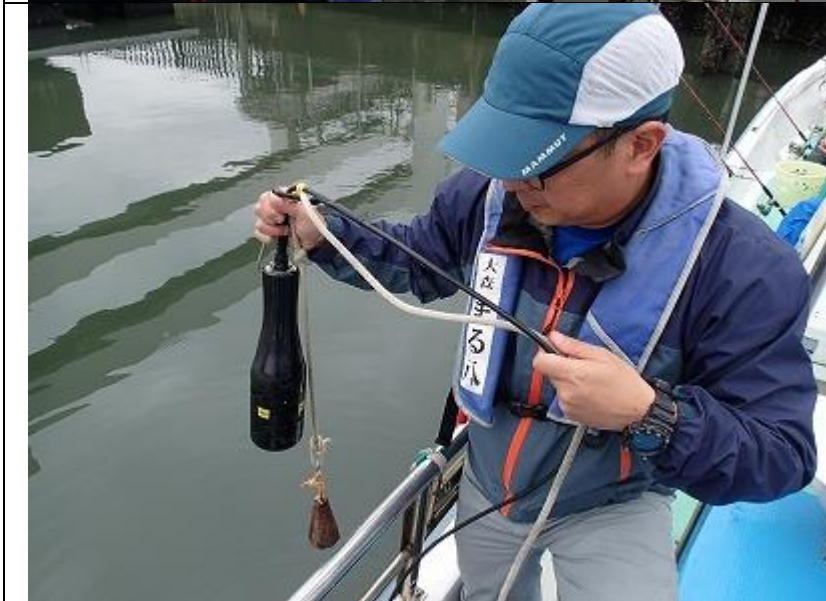
9月期 海域環境調査 水温・塩分・DO の測定